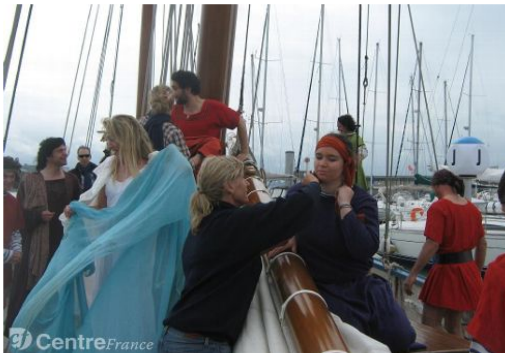
Le tournage s'apprête à démarrer à bord du bateau.